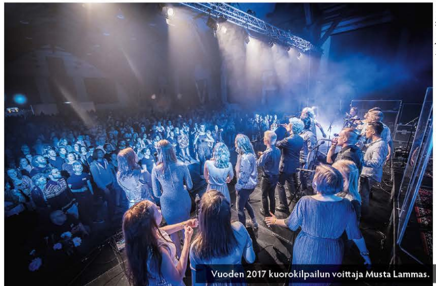
Vuoden 2017 kuorokilpailun voittaja Musta Lammas.

"Meille oli tärkeää osoittaa alusta asti, että olemme varteenotettava tulokas kuorokentällä, ja että rytmimusiikkia voi tehdä yhtä kunnianhimoisesti ja laadukkaasti kuin muutakin kuoromusiikkia. Aarhus Vocal Festival on yksi harvoja tapah-