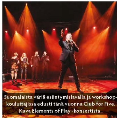
Suomalaista väriä esiintymislavalla ja workshop-kouluttajissa edusti tänä vuonna Club for Five. Kuva Elements of Play -konsertista.